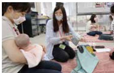
家庭訪問(学内演習)