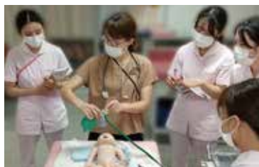
新生児蘇生法(Aコース)講習会