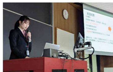
助産学研究(事例研究)発表会