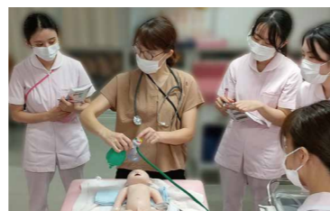
新生児蘇生法(Aコース)講習会